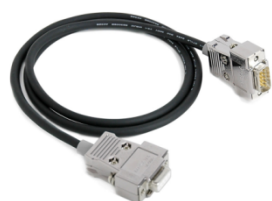
通信ケーブル 1m 1 オリジナル製品