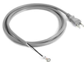
AC100V ケーブル 2m 1 オリジナル製品