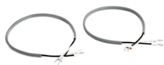
AC100V ケーブル (両端裸端子) 0.3m 2 オリジナル製品